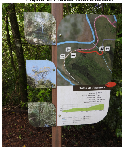
Figura 7: Placa da trilha interna.