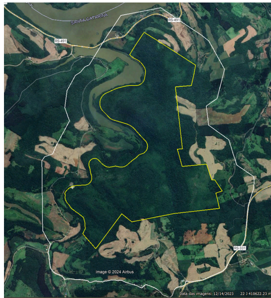
Figura 12: Imagem de satélite da UC e sua ZA.