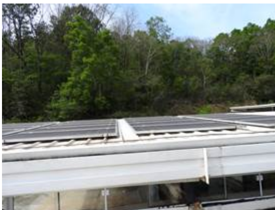
Figura 5: Placas fotovoltaicas.