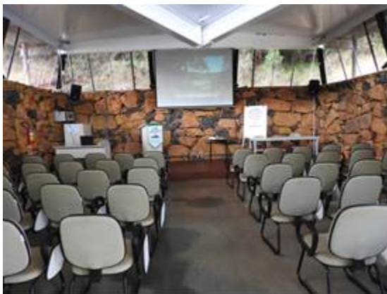
Figura 3: Auditório do Parque Natural.