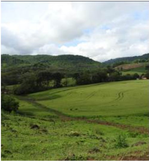
Figura 11: Paisagem fragmentada do entorno a UC.