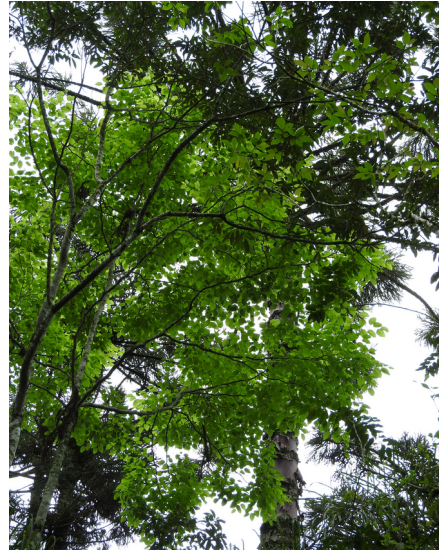
Figura 10: Hovenia dulcis dentro da mata da UC.