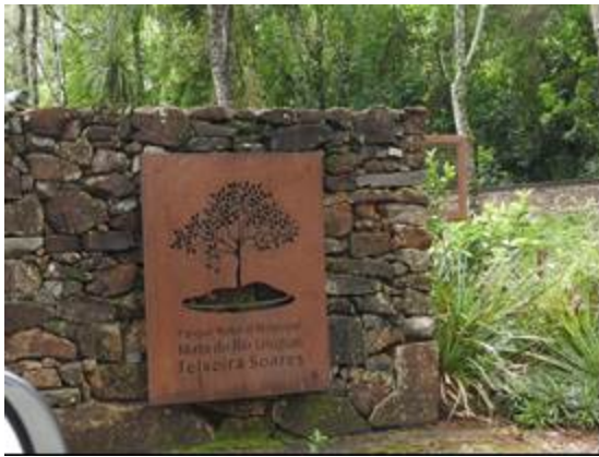
Figura 1: Pórtico de entrada do Parque Natural.