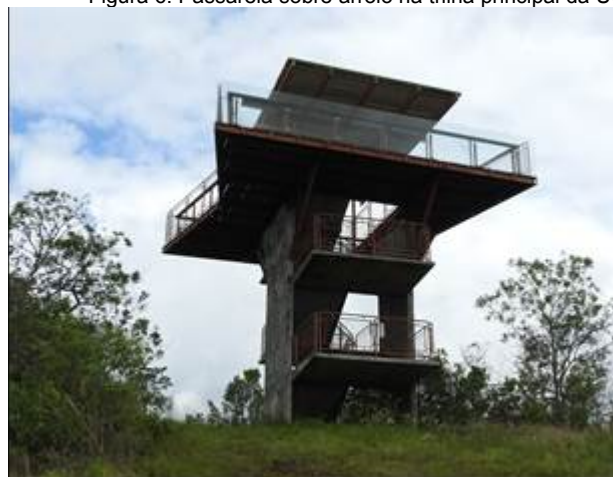
Figura 8: mirante da Trilha Passeio do Belvedere.