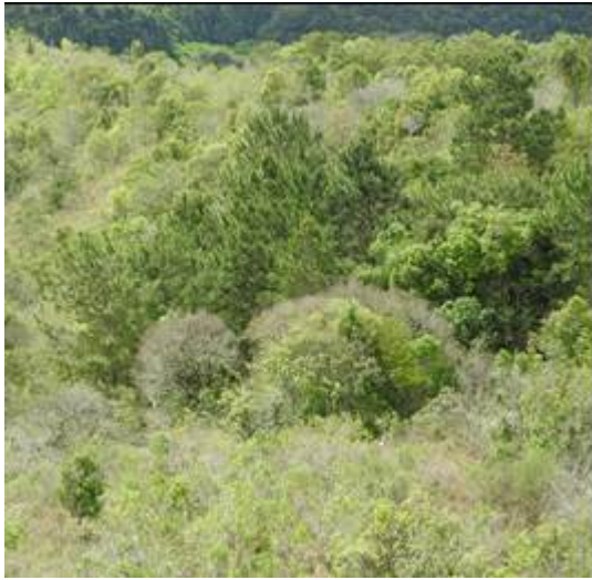
Figura 9: Indivíduos de Pinus sp. dentro da UC.