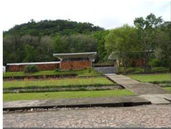
Figura 2: Centro de visitantes da UC.