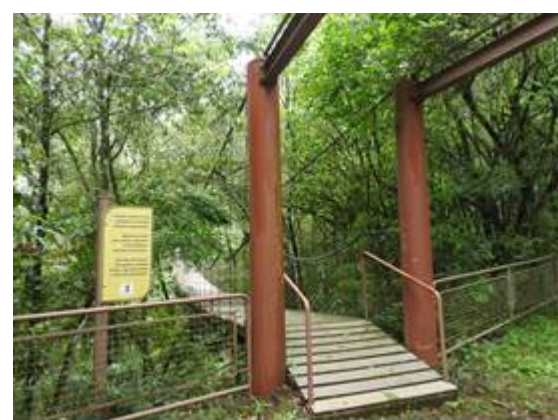
Figura 6: Passarela sobre arroio na trilha principal da UC.