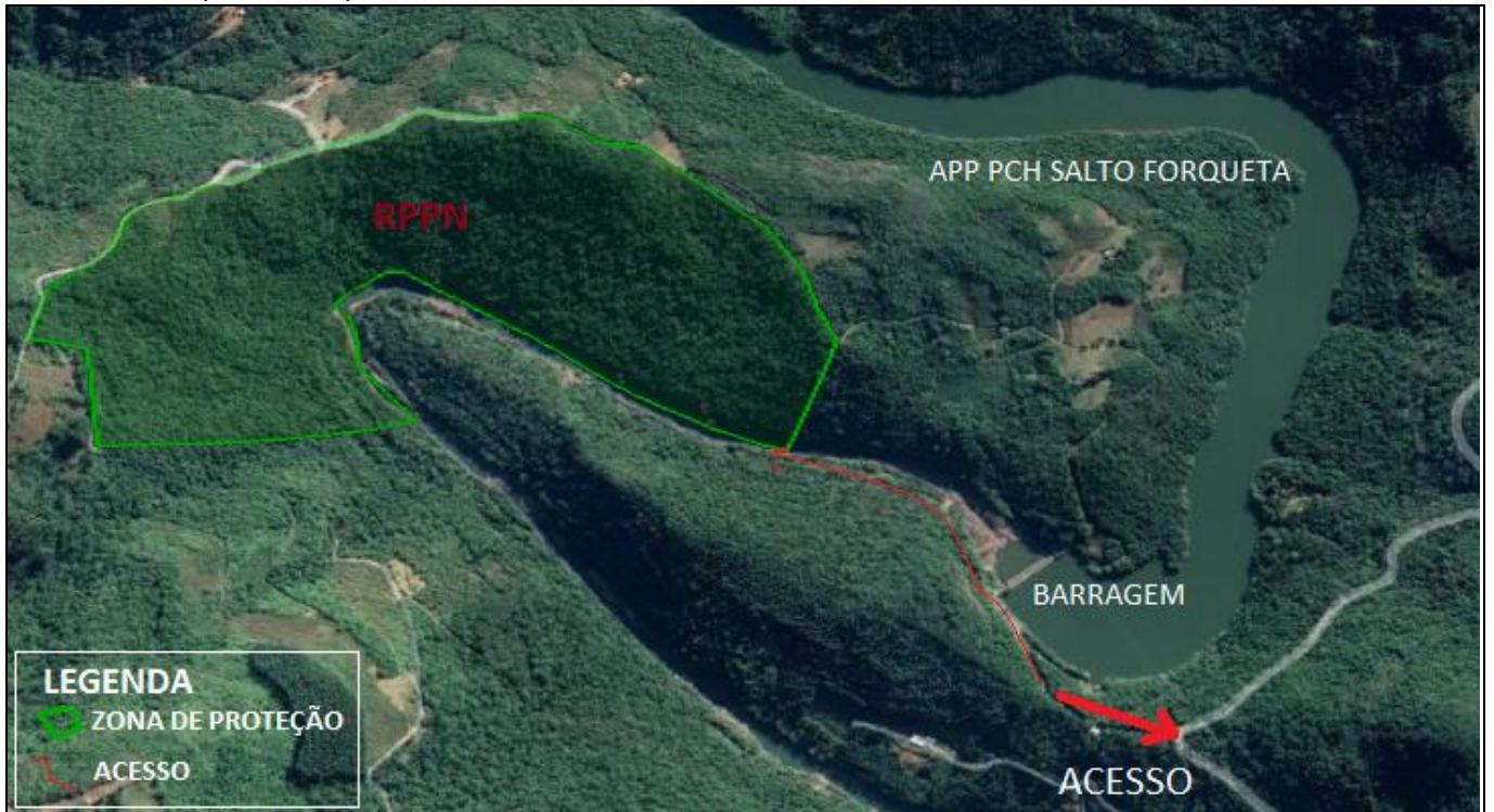
ANEXO III: Mapa ou croqui do zoneamento da RPPN.