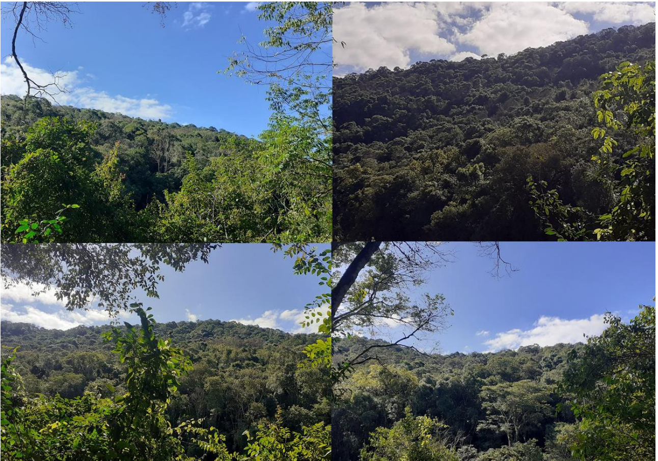
FOTO 5. Imagens de aspectos da vegetação na RPPN vistas da outra margem do Rio Forqueta.