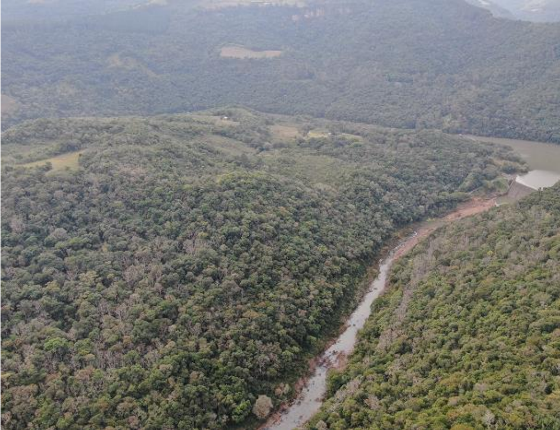
FOTO 4. Imagem feita com drone mostrando a extensão da RPPN.

FOTO 3. A conectividade das áreas da RPPN com a APP da PCH SALTO FORQUETA e outros maciços incorpora uma excelente qualidade ambiental à toda a região.