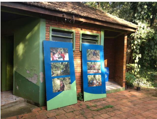
Imagem 5: banheiros públicos e banners de atividades de educação ambiental realizadas;