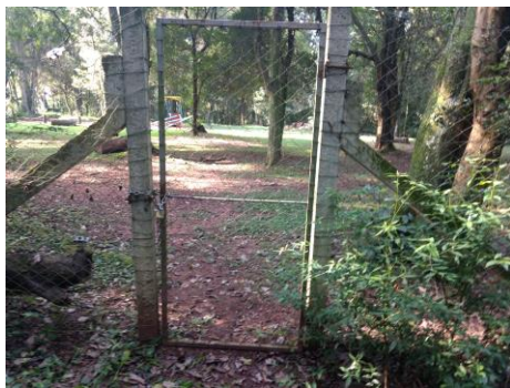
Imagem 9: cerca interna que divide as trilhas educativas da área de lazer.