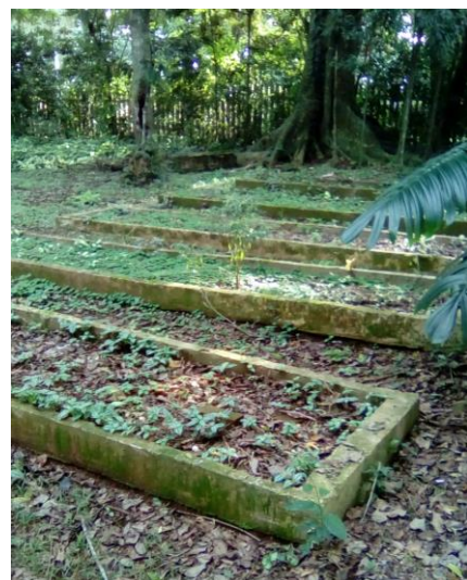
Imagem 6: viveiro desativado;