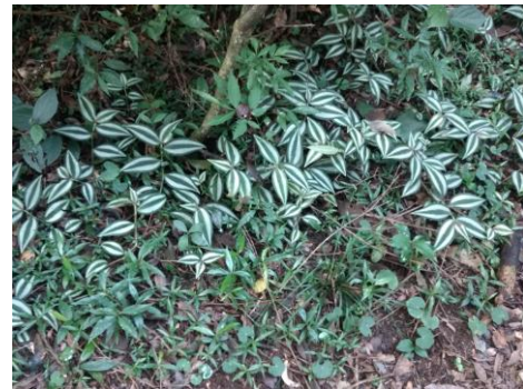
Imagem 10: Tradescantia sp. espécie exótica dentro da Unidade de Conservação.