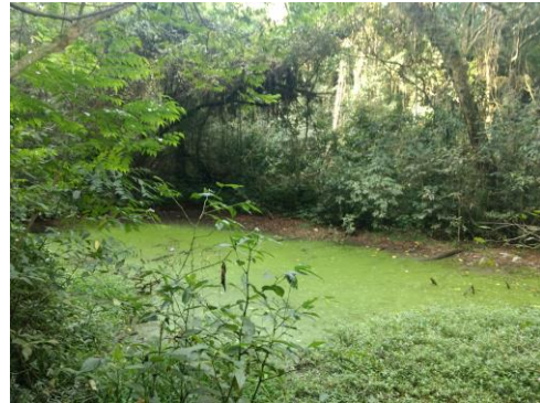
Imagem 8: nascente do arroio Passinho;