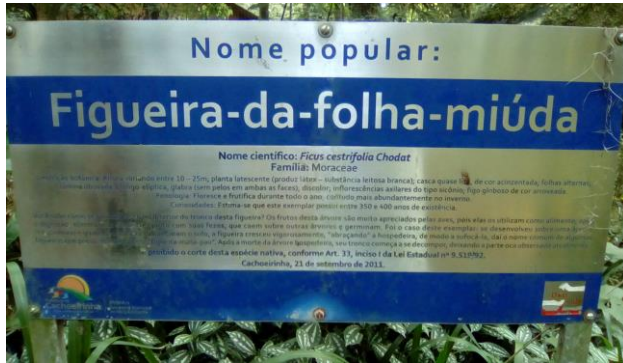
Imagem 7: placa interna informativa de espécies nativas da UC;