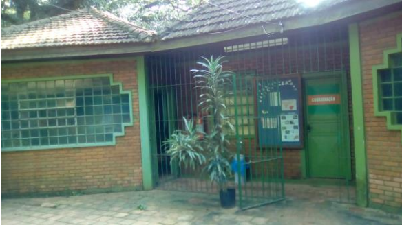
Imagem 1: Centro de Educação Ambiental Francisco de Medeiros , onde estão o auditório e os materiais de educação ambiental;