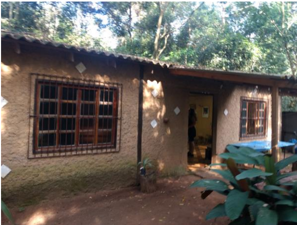
Imagem 3: sala de atividades educativas e exposições itinerantes;