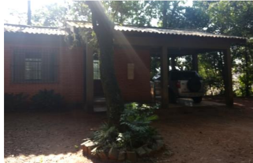
Imagem 2: Sede administrativa do PMDTAN ;