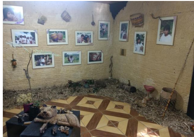
Imagem 4: exposição itinerante da cultura indígena;