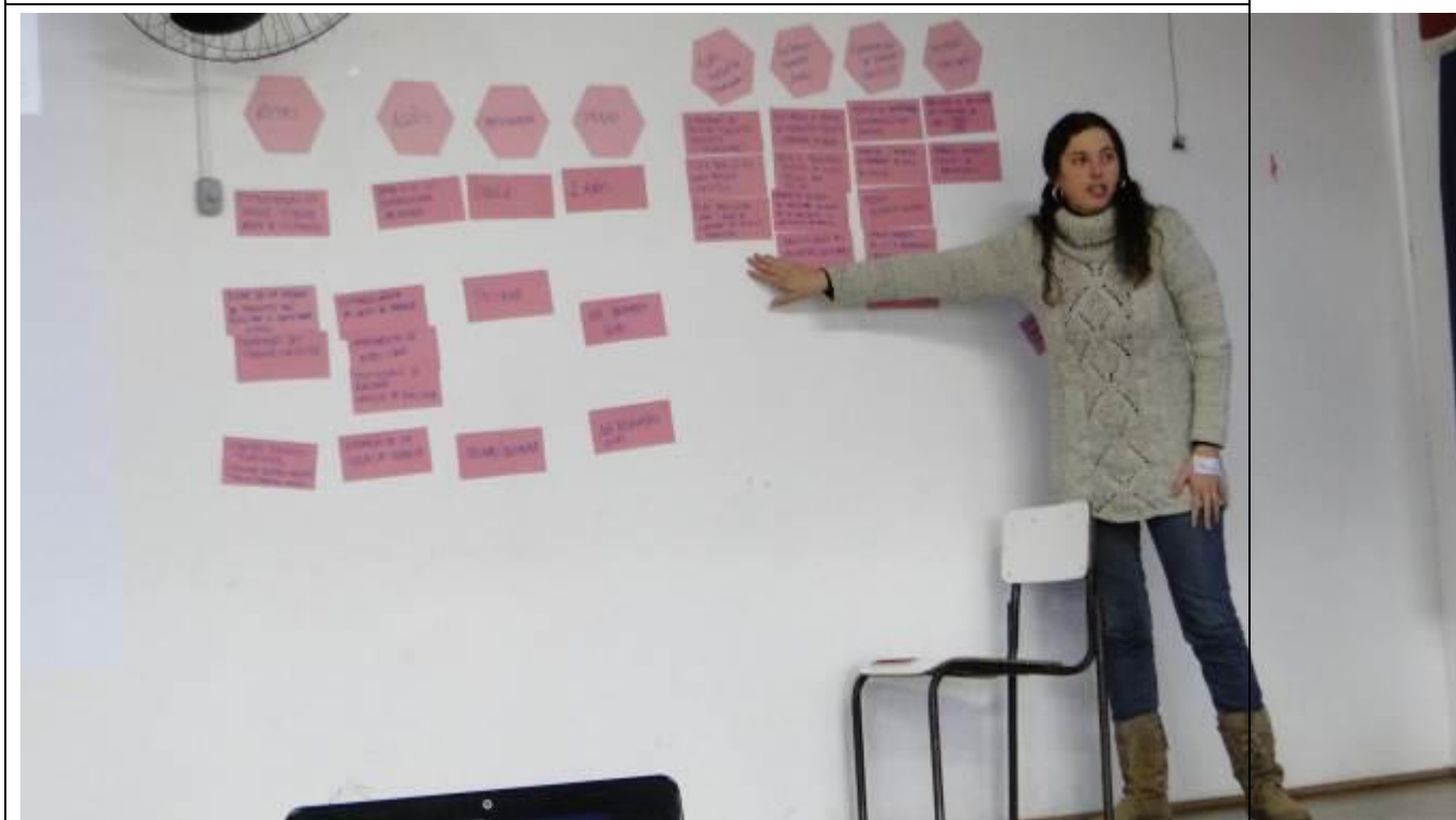
Foto 12: Oficina realizada em Barra do Quaraí para proposição e discussão de ações.