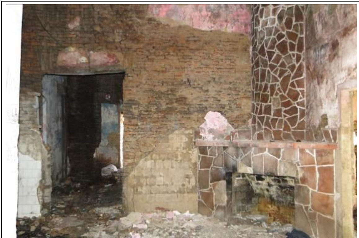
Foto 5: Prédio histórico em Barra do Quaraí (Rincão do Saladero) em péssimo estado de conservação.