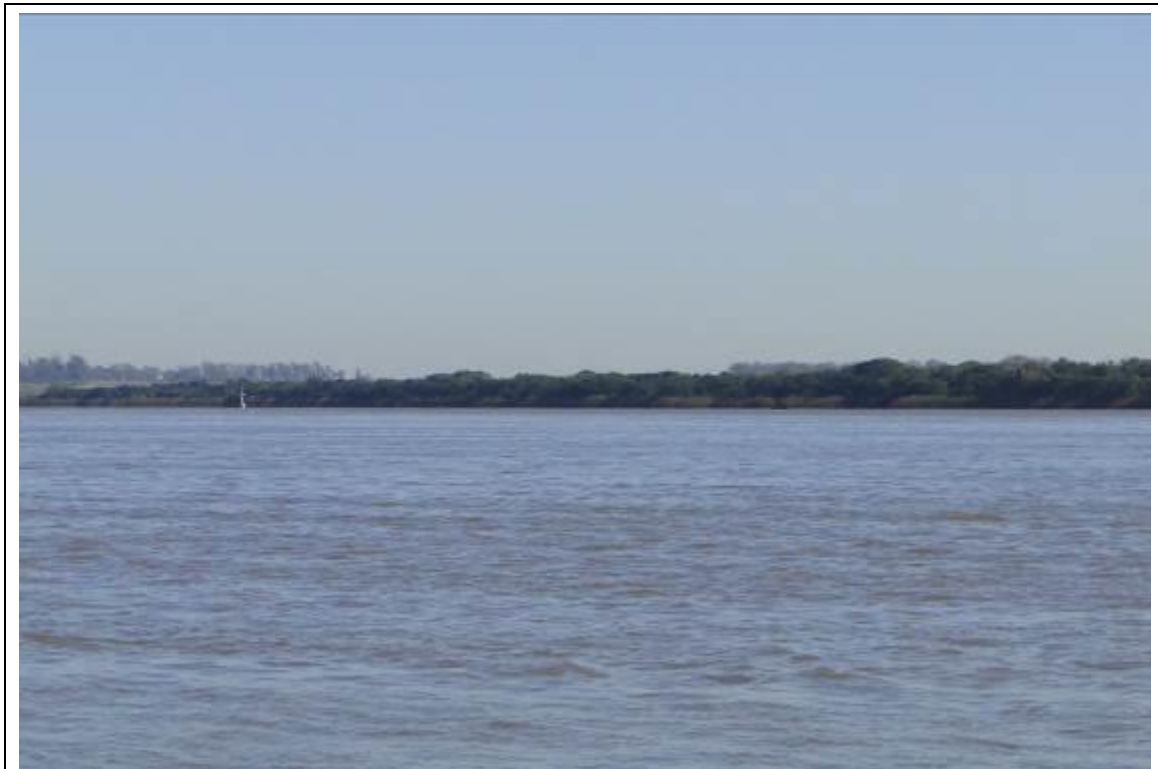
Foto 15: Ilha Brasileira, local com potencial turístico trinacional (Brasil, Uruguai e Argentina).