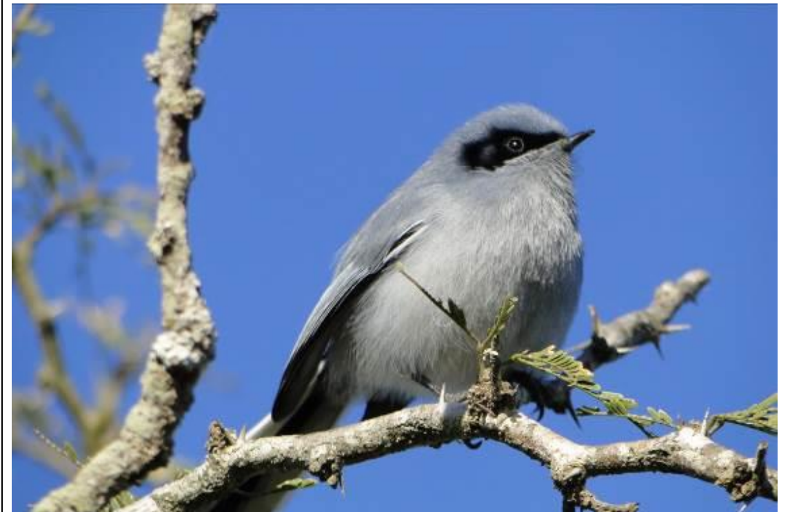
Foto 2: Balança-rabo-de-máscara ( Polioptila dumicola ), ave comum na região de Barra do Quaraí.