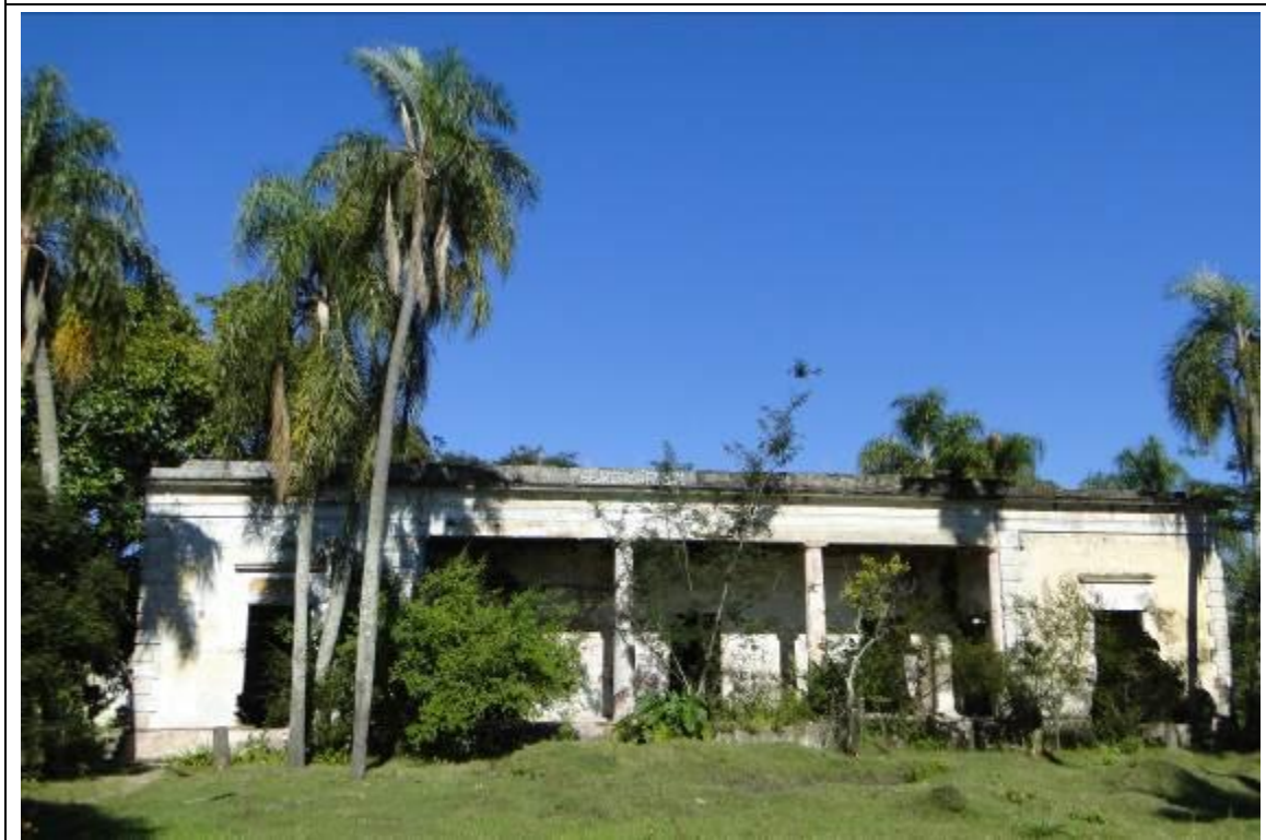
Foto 16: Rincão do Saladero, prédio histórico com potencial turístico na região.