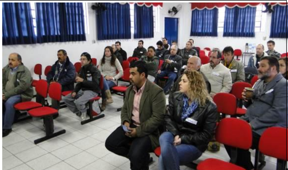
Foto 10: Oficina realizada em Barra do Quaraí para proposição e discussão de ações.