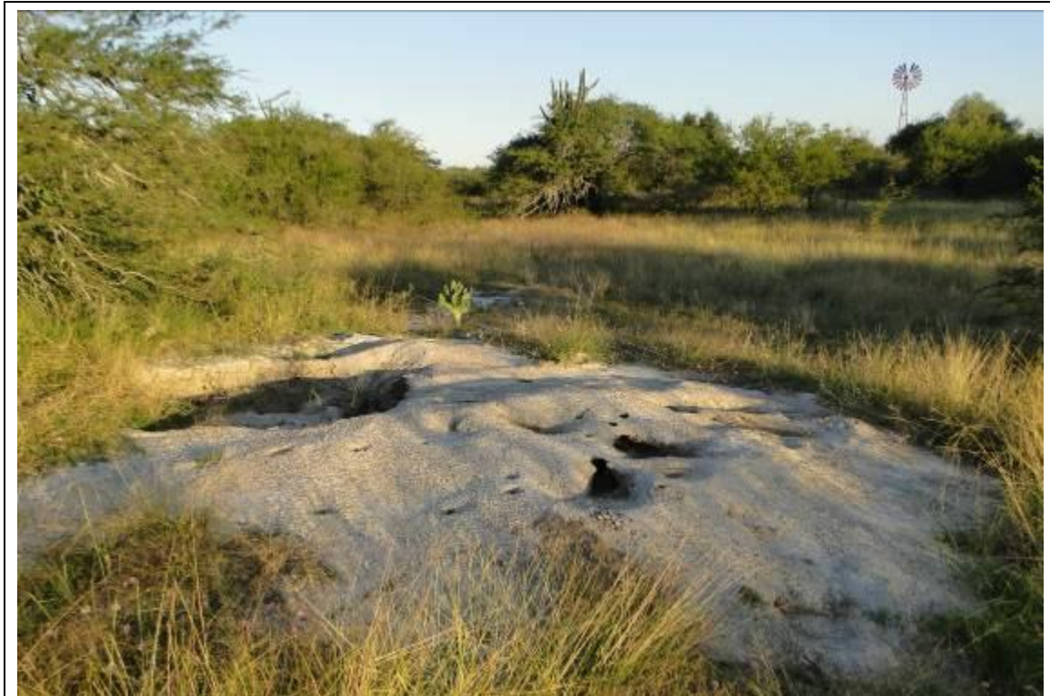
Foto 13: Formigueiro de Atta vollenweideri , espécie de formiga típica da região que deve ser monitorada.