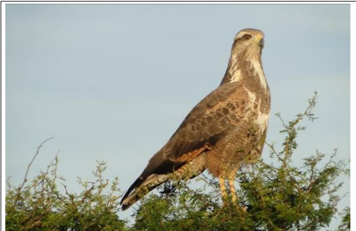
Foto 1: Gavião-caboclo ( Heterospizias meridionalis ) na Zona de Amortecimento do Parque Estadual do Espinilho.