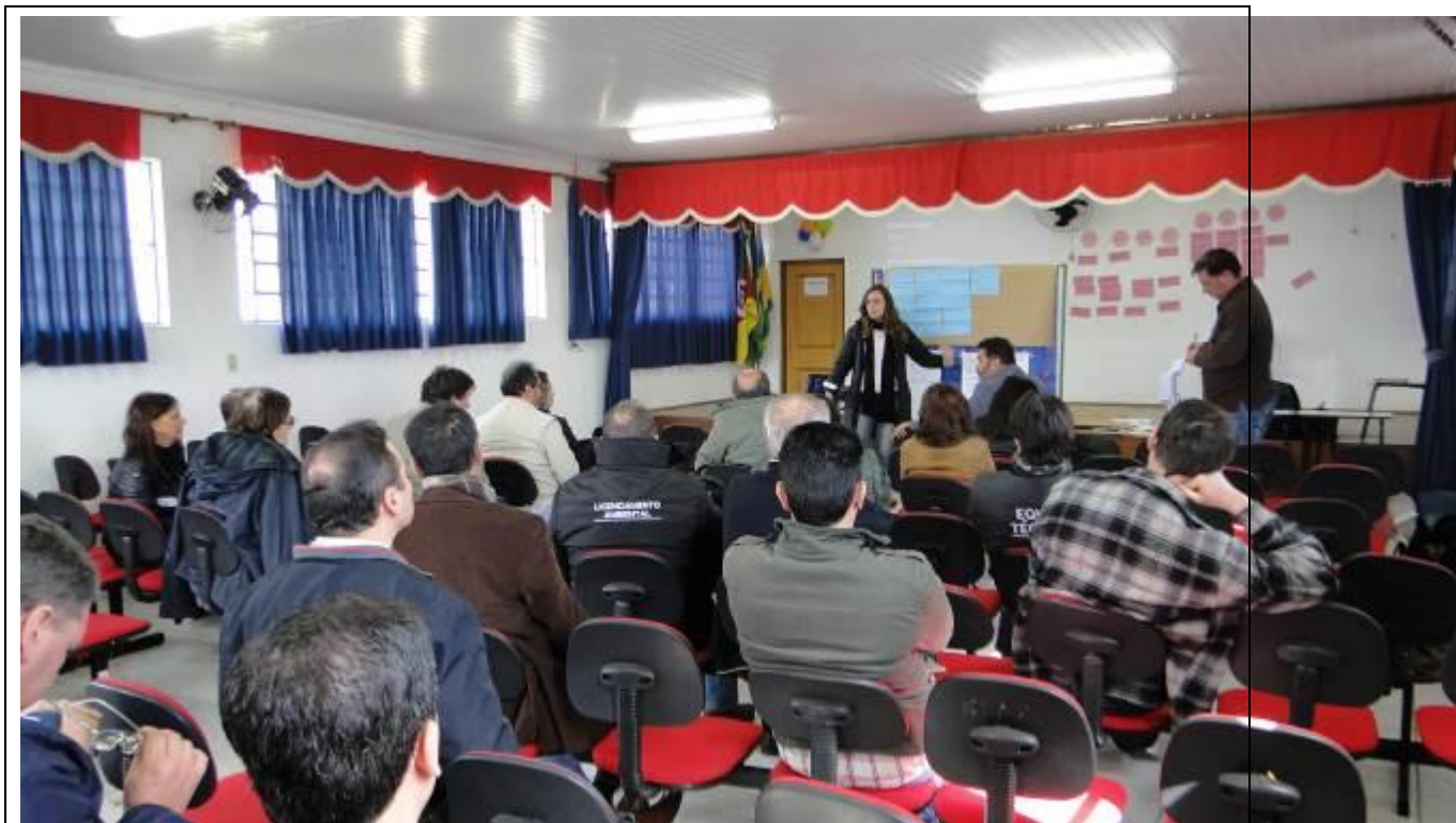
Foto 11: Oficina realizada em Barra do Quaraí para proposição e discussão de ações.