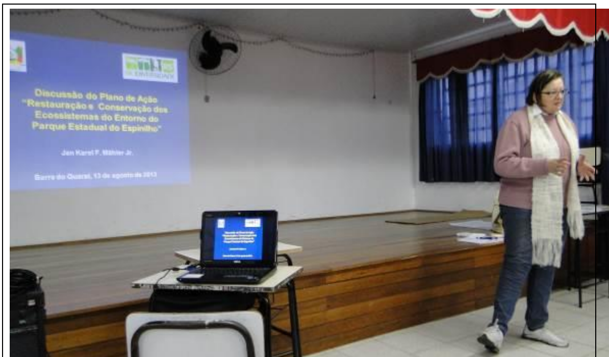
Foto 9: Oficina realizada em Barra do Quaraí para proposição e discussão de ações.