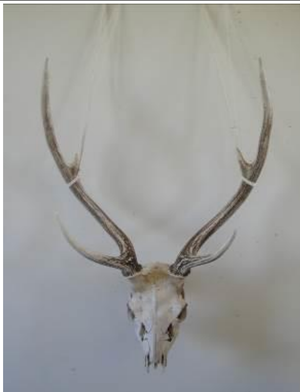
Foto 6: Crânio de chital ( Axis axis ), espécie exótica encontrada na região.