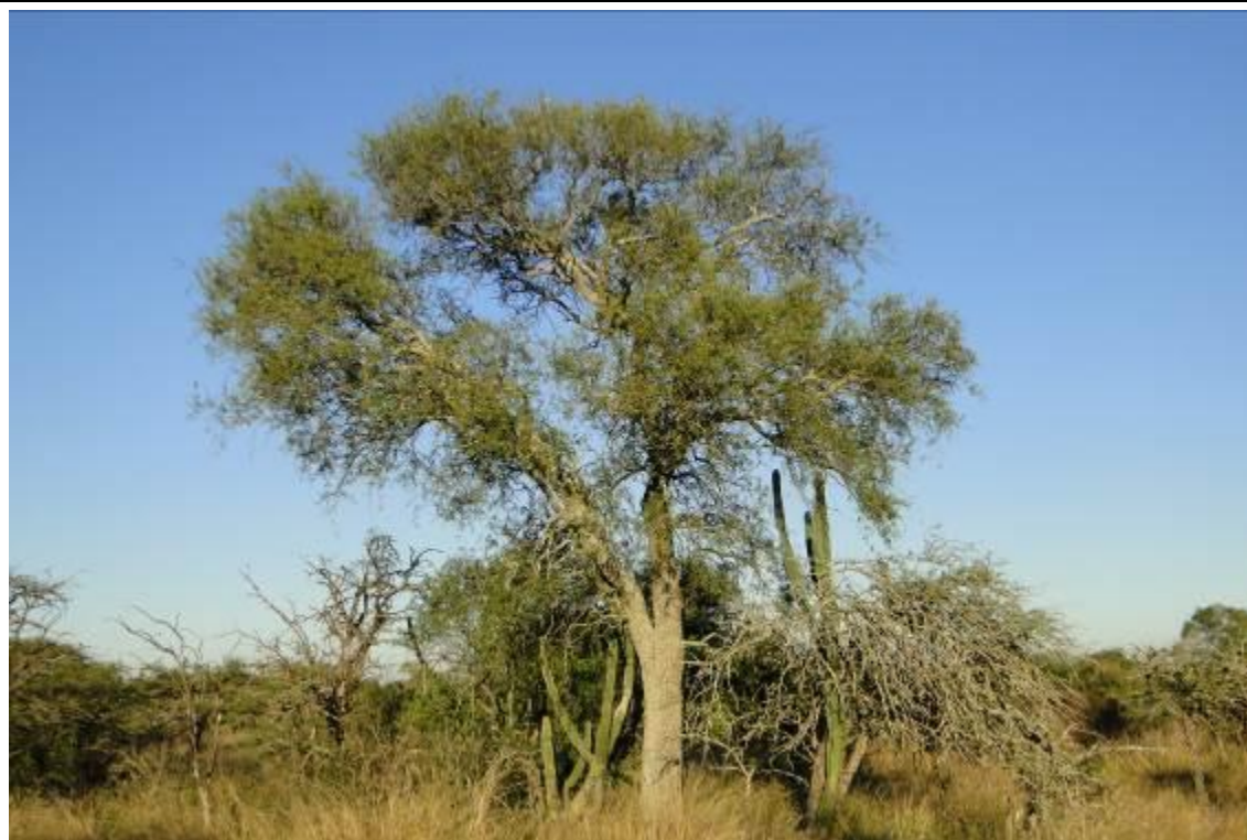
Foto 4: Quebracho-blanco ( Aspidosperma quebracho-blanco ), espécie arbórea ameaçada de extinção.